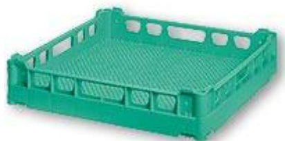
BK Casier à couverts à mailles serrées