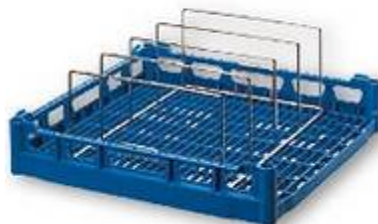
WHT 4 / WHT 5 Module WHT4 pour 4 cassettes repas, Module WHT5 pour 5 cassettes repas