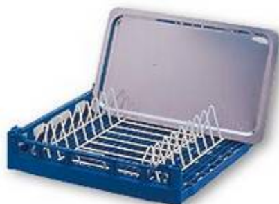
NKT Module pour plateaux en Rilsan pour 9 grands plateaux pour casier de base découpé d'un côté