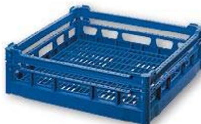
NK 110 Casier de base NK surélevé dimension hauteur utile intérieure 110 mm