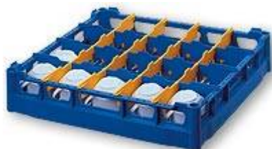
S 4x5/75 Casier à tasses pour 20 tasses en position inclinées