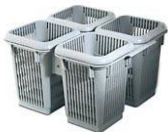
CBS 4 Porte-couverts CBK Clip- porte couverts