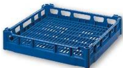
NK Casier de base à mailles larges