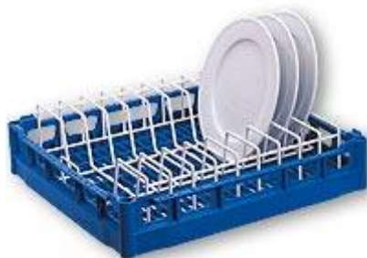
PTE Module en Rilsan s'intégrant dans le casier de base NK pour 9 grandes assiettes