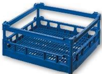
NK 160 Casier de base NK surélevé dimension hauteur utile intérieure 160 mm