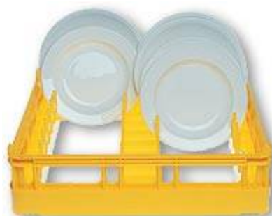
P15 Casier à assiettes pour 15 grandes assiettes plates ou creuses à partir de \varnothing 18 cm