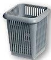
CBS Porte-couverts Silvercup s' intégrant dans le casier à assiette UK