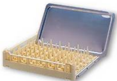
UKT pour 8 grands plateaux avec renfort Niro