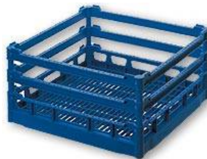
NK 210 Casier de base NK surélevé dimension hauteur utile intérieure 210 mm