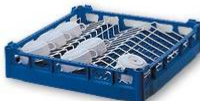
TE3 Module à tasses TE3 en Rilsan pour casier de base NK