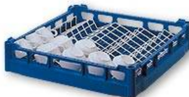
TE5 Module à tasses TE5 en Rilsan pour casier de base NK