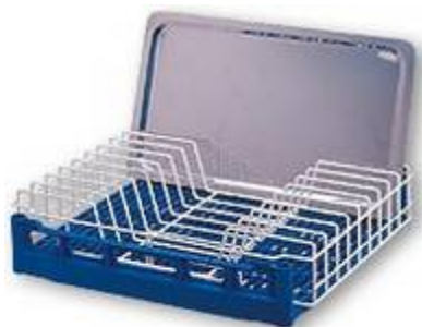
GN 1/1 Module pour plateaux en Rilsan pour grands plateaux pour casier de base NK coupés des 2 cotés