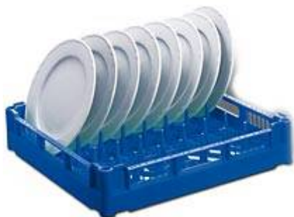
UK pour 16 assiettes plates ou 12 assiettes creuses