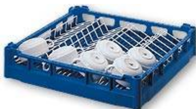
TE4 Module à tasses TE4 en Rilsan pour casier de base NK